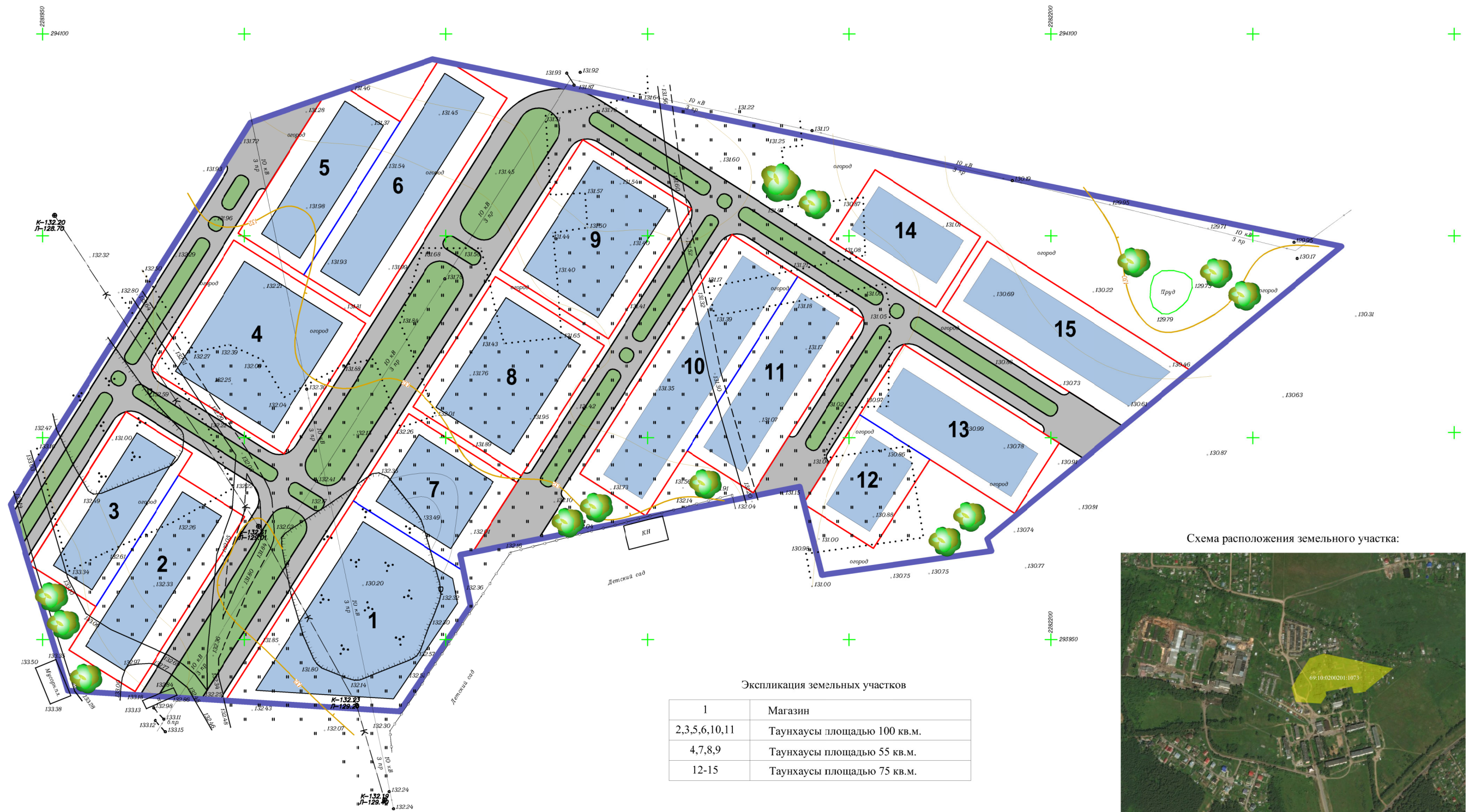
Схема расположения земельного участка: